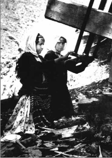
■ "Tez" in altbaşında kadınlar durur. Bu hem onların daha az yorulması, hem de olası bir tehlikeden daha az zarar görmeleri içindir.

Dağlarda, 15 ile 20 çadırdan oluşan obalarda yaşarlarmış. Her obanın orman idaresi veya tüccarla bağlantısını kuran, Tahtacılar'ın "keye" dediği bir kahyası varmış. Kestikleri ağaçları işleyip,