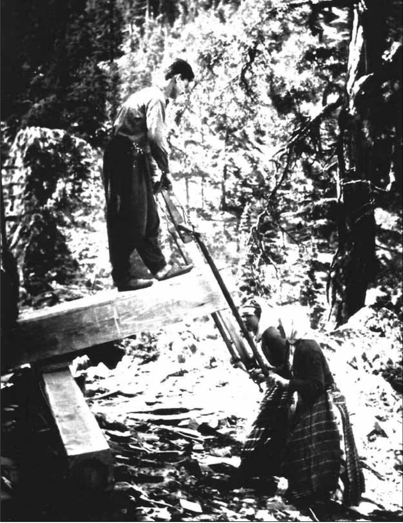
■ Makineleşmeden önce, "Tez" denilen ağaç kesme düzeneğinde, "golasdar" denilen el bıçkılarıyla ve "kapak atma" denilen yöntemle ağaç kesilirdi.