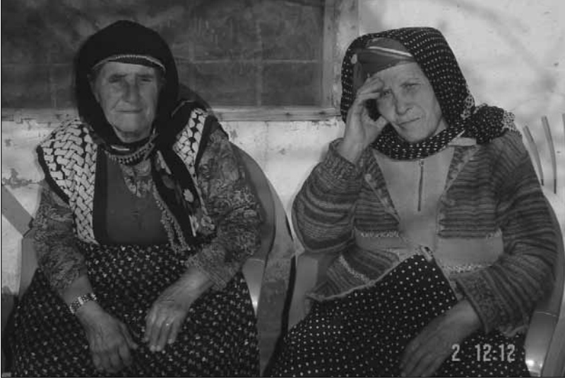
Antalya'nın Elmalı İlçesi Akçaeniş Köyü'nde, günlük giysileri içinde Tahtacı kadınları.