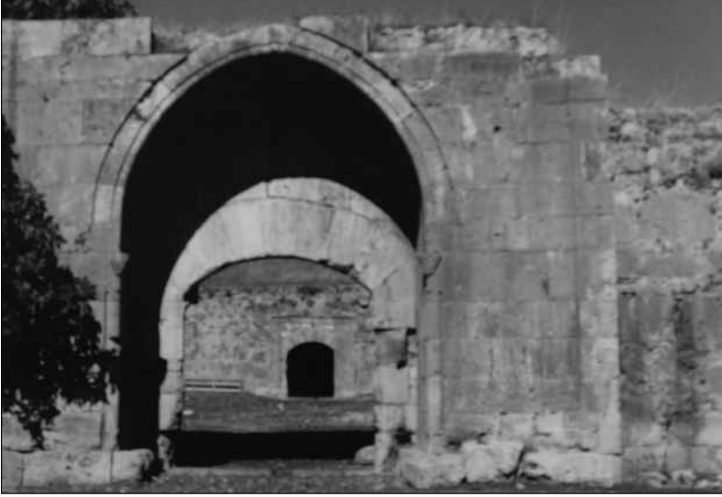
■ Kırkgözhane, Antalya.

tahıl ve pamuk ihtiyaçlarının yanında fazlasını yetiştirmektedirler. Türkmen-yörük ekonomik etkinliklerinden biri de halı dokumacılığı ve ihracıdır. Antalya limanından ihraç edilen maddelerin en önemlisi daha önce bahsedildiği gibi halı, kilim gibi dokumalardır. Bütün bunlarla birlikte, Toros yörüklerinin en önemli ekonomik etkinliklerinden biri de keresteciliktir.