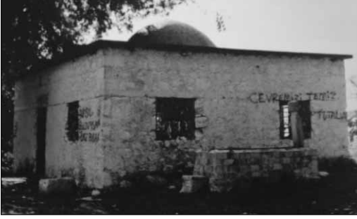
■ Kabi Baba Tekkesi (Finike)

Bu bilgileri arşivlerden takip etmek mümkündür. 1455 tarihli Tahrir Defteri'nde Elmalı, "Nefs-i Elmalu" şeklinde kaydedilmiş