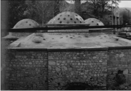
■ Alaaddin Hamamı, Korkuteli.

İstanos'un nüfusu, 1455'de 1045, 1530'larda 258, 1568'de 515-549, 1901'de 16 202 civarındadır. 1990'lardaki nüfusu ise 13 381 kişidir. İkinci derecede öneme sahip olan Antalya- Korkuteli-İspar-