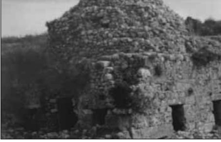
■ Silyon antik kentinde, Osmanlı döneminden kalma bir cami.

Karahisar-ı Teke, bölge ticaretinde önemli bir yere sahiptir. Çünkü, doğu-batı istikametindeki ticaret yolları bu bölgeden geçer. Özellikle Aspendos Köprü Çay'ın denizle bağlantısı nedeniyle, burada bir iskele olduğunu ve iskelede kurulan pazarın yakın dönem-