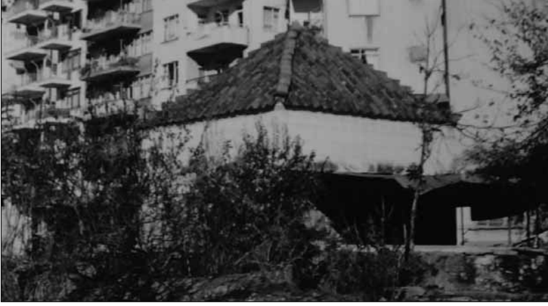
■ Şeyh Şüceaddin Türbesi, Antalya.

hinde 35 olduğunu ve 1837’de 47’ye çıktığını tespit etmiştir. Ayrıca bu mahallelerin tamamında, Türk-İslam nüfusunun yaşadığını, sadece Cami-i Cedid ve Makbul Ağa mahallelerinde çok az sayıda Rum’un, Türkler’le karışık yaşadıklarını belirtmiştir.