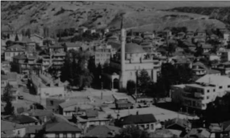
■ Ömer Paşa Cami ve çevresi, Elmalı.

Yine Elmalı'ya yakın Tekke Köy'de bulunan Abdal Musa Tek-