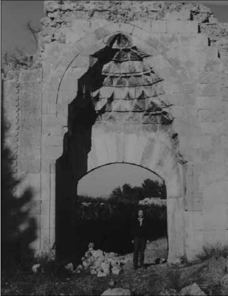
■ Emdir Han girişi.

Halkın geçimini genellikle tarım yoluyla temin etmesi, nüfus-