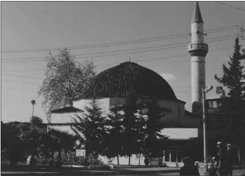
■ Bali Bey Camii, Antalya.

XV.-XVI. yüzyılların Teke Sancağı’nda gayrimüslim sayısı oldukça azdır. Karahisar-ı Teke denilen kalede bir miktar, biraz da Elmalı ve Korkuteli’nde görülür. Antalya merkezinde ise çok daha azdır. Burada en çok Babadoğan, Makbul Ağa, Cami-i Cedid mahallelerinde yoğunlaşırlar. Evliya Çelebi’ye göre ise, XVII. yüzyılda, Antalya’da, 20 Müslüman ve 4 Rum mahallesi vardır. Rıfat Özdemir’in yaptığı incelemeler neticesinde, bu mahallelerin 1830 tari-