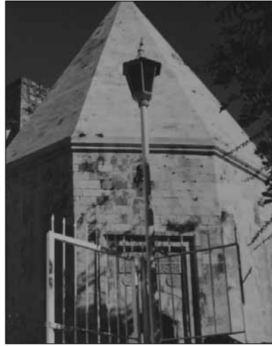
■ Zincir Kırın Mehmet Bey Türbesi.

Bugün hala yerleşim alan ve isim olarak devam eden yerlerin yanı sıra, artık kullanılmayan nahiyeler ve isimler de vardır. Mese-la, İğdir Boyu'nun kurulduğu İğdir nahiyesi Kemer bölgesine, Ba-