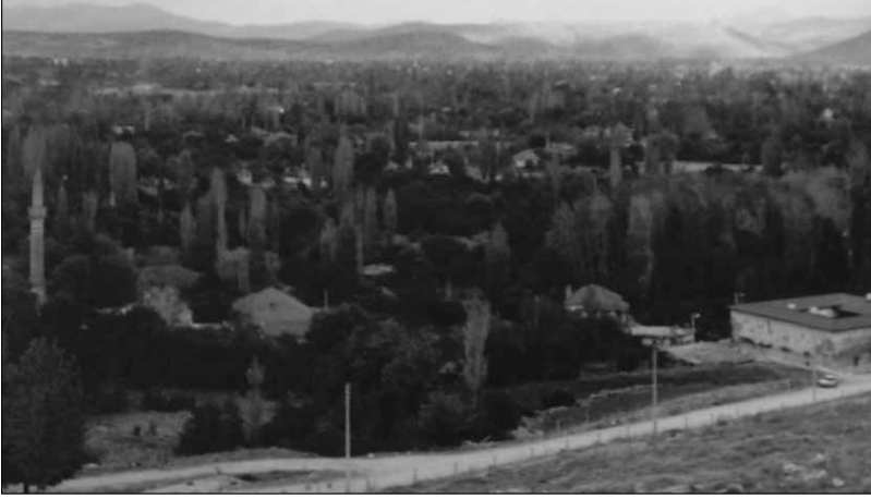
Alaaddin Camii ve Sinanaddin Medresesi, Korkuteli.