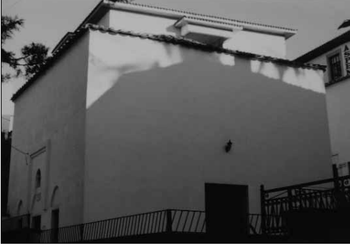
■ Kaleiçi, Ahi Yusuf Mescidi.

Şehrin ilk kurulduğu bölge bugünkü Kaleiçi'dir. Yerleşim alanları, daha sonra Bali Bey Cami ve Murat Paşa Cami yönünde geniş-